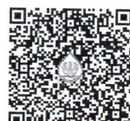
รายงานสรุปผลการประชุมผิมน้ำ ครั้งที่ ๒