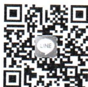
Line โครงการฯ