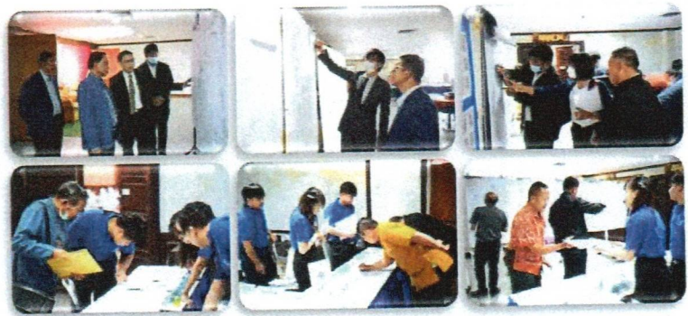
ลงทะเบียน รับเอกสาร ชมบอร์ดนิทรรศการ