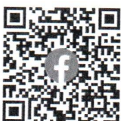
Facebook โครงการฯ

รองเลขาธิการ ปฏิบัติราชการแทน เลขาธิการสำนักงานทรัพยากรน้ำแห่งชาติ