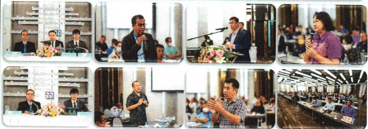
บรรยากาศในห้องประชุม และการให้ข้อเสนอแนะ/แสดงความคิดเห็นต่อการจัดทำร่างผั่งน้ำและผลการศึกษาต่าง ๆ

รูปที่ 1 ภาพบรรยากาศการจัดประชุมผั่งน้ำ ครั้งที่ 2 วันพุธที่ 27 กันยายน 2566 เวทีที่ 1 ณ ห้องเฮอริเทจ บอลรูม ชั้น L โรงแรมเฮอริเทจเชียงราย ไฮเทล แอนด์ คอนเวนชัน อ่าเภอเมืองเชียงราย จังหวัดเชียงราย