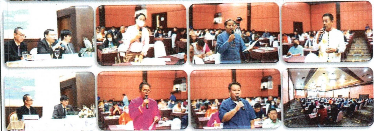
บรรยากาศในห้องประชุม และการให้ข้อเสนอแนะ/แสดงความคิดเห็นต่อการจัดทำร่างผิ่่งน้ำและผลการศึกษาต่าง ๆ

รูปที่ 2 ภาพบรรยากาศการจัดประชุมผิ่่งน้ำ ครั้งที่ 2 วันพฤหัสบดีที่ 28 กันยายน 2566 เวทีที่ 2 ณ ห้องพุดตาน ชั้น 3 โรงแรมพะเยาเกทเวย์ อำเภอเมืองพะเยา จังหวัดพะเยา