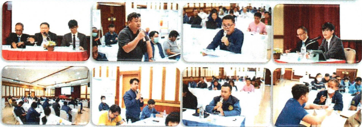
บรรยากาศในห้องประชุม และการให้ข้อเสนอแนะ/แสดงความคิดเห็นต่อการจัดทำร่างฝั้่งน้ำและผลการศึกษาต่าง ๆ

รูปที่ 3 ภาพบรรยากาศการจัดประชุมฝั้่งน้ำ ครั้งที่ 2 วันศุกร์ที่ 29 กันยายน 2566 เวทีที่ 3 ณ ห้องออเร้นจ์ ชั้น 2 โรงแรมแทนเจอร์วิลลส์ อำเภอฝาง จังหวัดเชียงใหม่