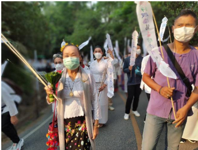
เทศบาลตำบลแม่จัน อำเภอแม่จัน จังหวัดเชียงราย