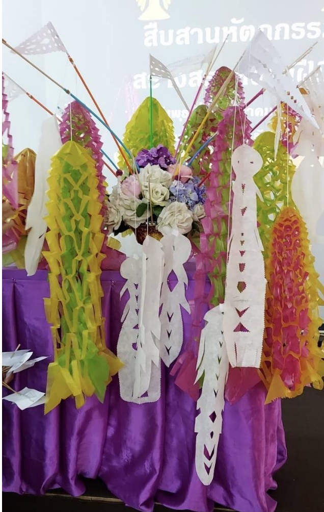
เทศบาลตำบลแม่จัน อำเภอแม่จัน จังหวัดเชียงราย