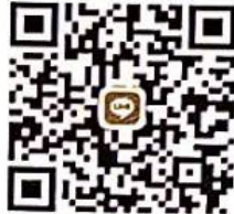
Line : แผนกที่ภาษี ทต.แม่จัน

ช่องทางที่ 1. ทางกองคลัง ยินดีส่งเจ้าหน้าที่ออกบริการเก็บเงิน ค่าภาษี , ค่าขยะ โดยไม่เสียค่าบริการใดๆ ทั้งสิ้น เพียงแต่ท่านโทรมาขอรับบริการดังกล่าว ได้ที่เบอร์ 053-771222 ต่อ115 หรือ Line : แผนกที่ภาษี ทต.แม่จัน ในวัน และ เวลาราชการ